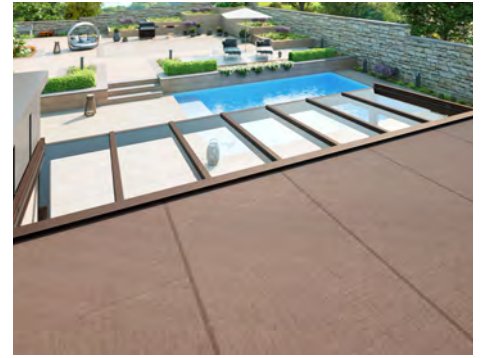
Ideale Beschattung für Glasdachsystem NYON